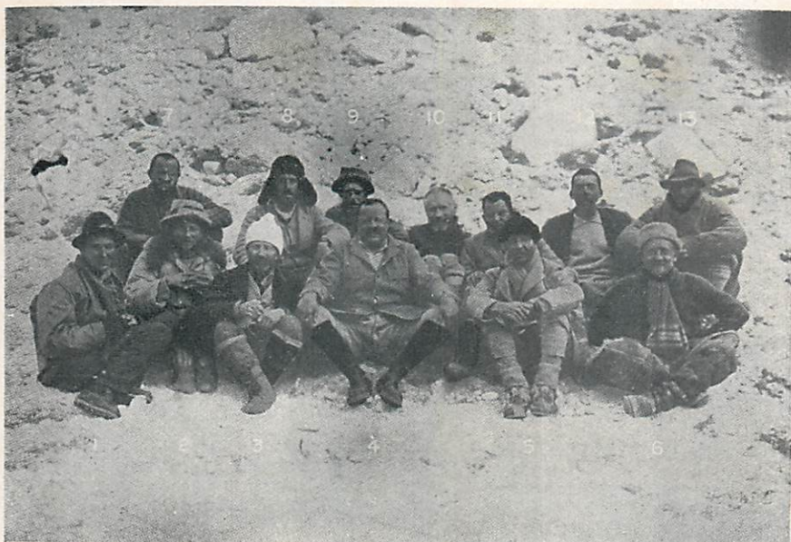
エヴェレスト探險隊首腦者