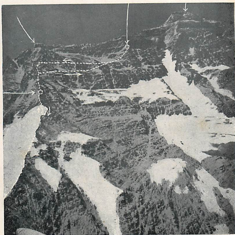
北面より見たるエヴェレスト山