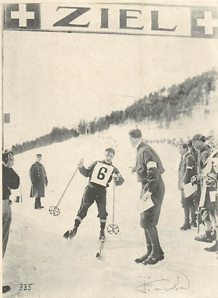
ヤンソン (50K.M 二着)